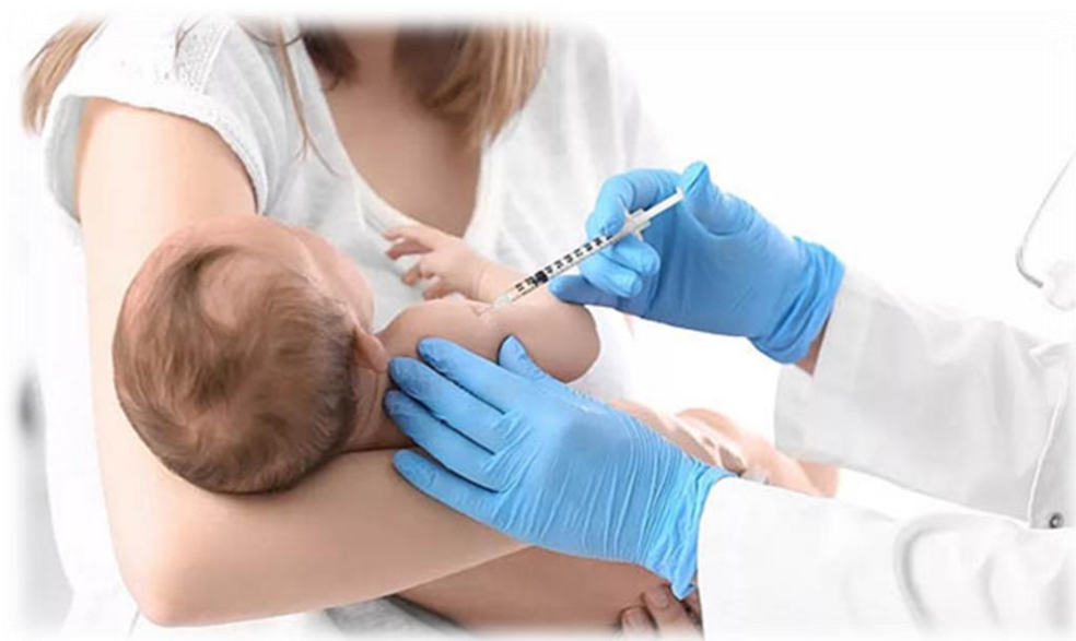
Схема вакцинации детей

Несмотря на то, что вакцинация против коклюша не защищает на 100 % от инфицирования, те, кто получили вакцину от коклюша, перенесут заболевание в легкой форме, быстрее по времени. Приступы кашля будут гораздо реже, риск осложнений - минимальный.